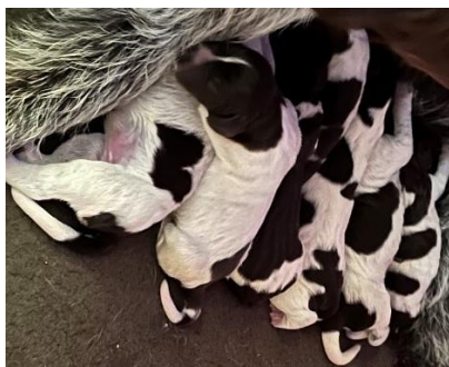
„A-Wurf von den Günteker Höfen“