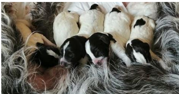
„A-Wurf vom Schießberg“