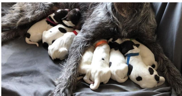
„A-Wurf zum Heitzhausen“