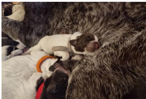
„B-Wurf vom Hunnenhügel“